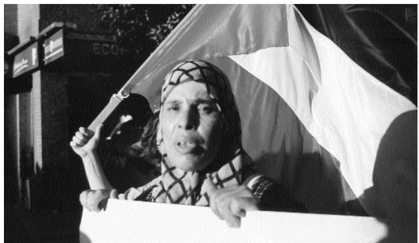
Mujeres marroquíes que participaron en una manifestación de apoyo al pueblo palestino celebrada en Sevilla (Fotos 5 y 6)

«Yo sólo he vivido tres años con él (su marido). Al final él quería mandar pero no podía, él quería no trabajar y yo sólo ganaba dinero, trabajaba mucho, y él no porque decía que no había dinero. A mi me gusta que los dos controlen no que el hombre controle a la mujer, que hagan lo que le gusta a ella, lo que le guste a él. Pero hay pocos hombres que dejen que sea entre los dos. Mi marido me ayudaba, hacía muchas cosas, porque yo estaba siempre trabajando, yo volvía a la casa cansada y él hacía las cosas, hacía la comida, recogía la mesa, y todo. Pero él me engañó porque yo quería que él trabajara en la fresa y él no quería. Le dijo a un amigo que «mi mujer me está buscando trabajo». Él mintió, él no quería trabajar en cualquier cosa decía que él no era ese trabajo para él, él decía que quería trabajar en