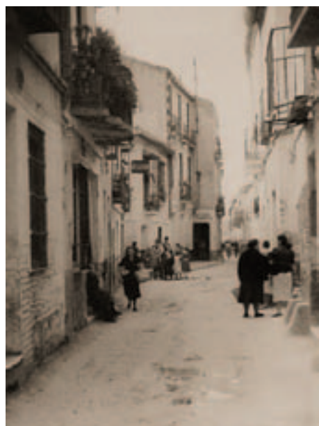
Callejones del Perchel

El 25 de abril se desataron una serie de protestas de los comunistas contra la República. Desde la plaza de la Merced partieron un grupo de personas con un estandarte que pedía «Pan y trabajo». Provocaron destrozos en las oficinas del Círculo Mercantil y en la farmacia del Globo, hasta que fueron disueltos por las fuerzas del orden. El Gobernador Civil mandó detener al Presidente del Comité de Obreros Parados, lo que provocó que los comunistas se concentraran en su sede en la calle Cerrojo, de donde