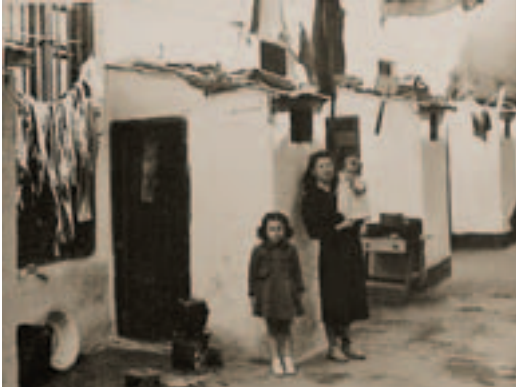
Viviendas de pescadores