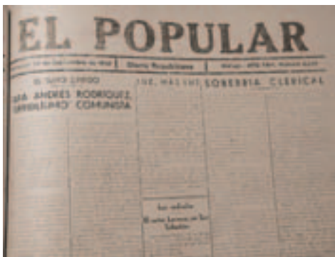
Titular de «El Popular» atacando al concejal comunista

enero sobre la huelga de taxis, sobre el obrero muerto por los guardias en el puente de Tetuán o la presentada en marzo sobre los obreros que fueron detenidos, se les imputaban delitos que no habían cometido y que tenían que soportar la represión en la comisaría o en la cárcel. En el mes de mayo los conflictos se centraron en el traslado del Centro de Fermentación de Tabaco, la supresión de la línea ferroviaria Málaga-Fuengirola o el cierre de la Industria Malagueña 17 .