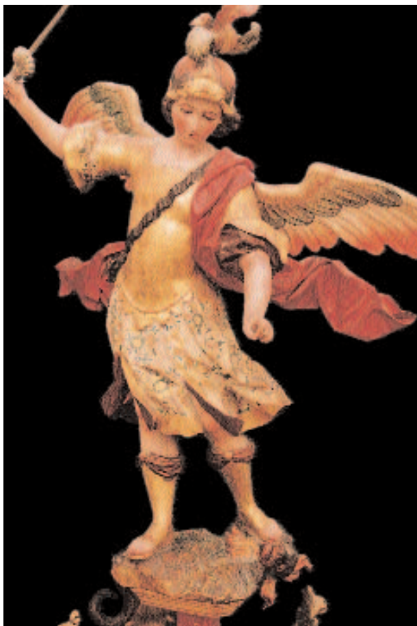
Anónimo, San Miguel Arcángel (c. 1763-1771)

fuere señalada... en la bóveda que está hacia la puerta enfrente del altar del Señor San Francisco, nada hacía imaginar que, casi dos centurias después, sus cenizas iban a protagonizar una rocambolesca historia de exhumaciones y traslados que, desde 1876, no verá su fin hasta 1996. En este sentido, cuando el 16 de Marzo de 1996 se procedía a depositar el arcón de cinc con el osario de Mena en una sencilla sepultura excavada a los pies de la iglesia conventual también cobraba verdadero y decisivo ímpetu el anhelo de crear un conjunto expositivo que difundiese y diese a conocer el interesante y valioso patrimonio artístico de la Abadía. Según apuntamos, los actos conmemorativos del III Centenario de la muerte del escultor, en 1988, habían supuesto un revulsivo al respecto, aunque diversos inconvenientes frustraron, por entonces, la materialización del proyecto. El retorno de Mena al Císter parecía ser el mejor momento para activarlo y, así, el 29 de Noviembre de 1997, abrió sus puertas al público ese sugestivo escarapate del Barroco cual es el Museo de Arte Sacro. Justo es decir que esta feliz realidad sería factible