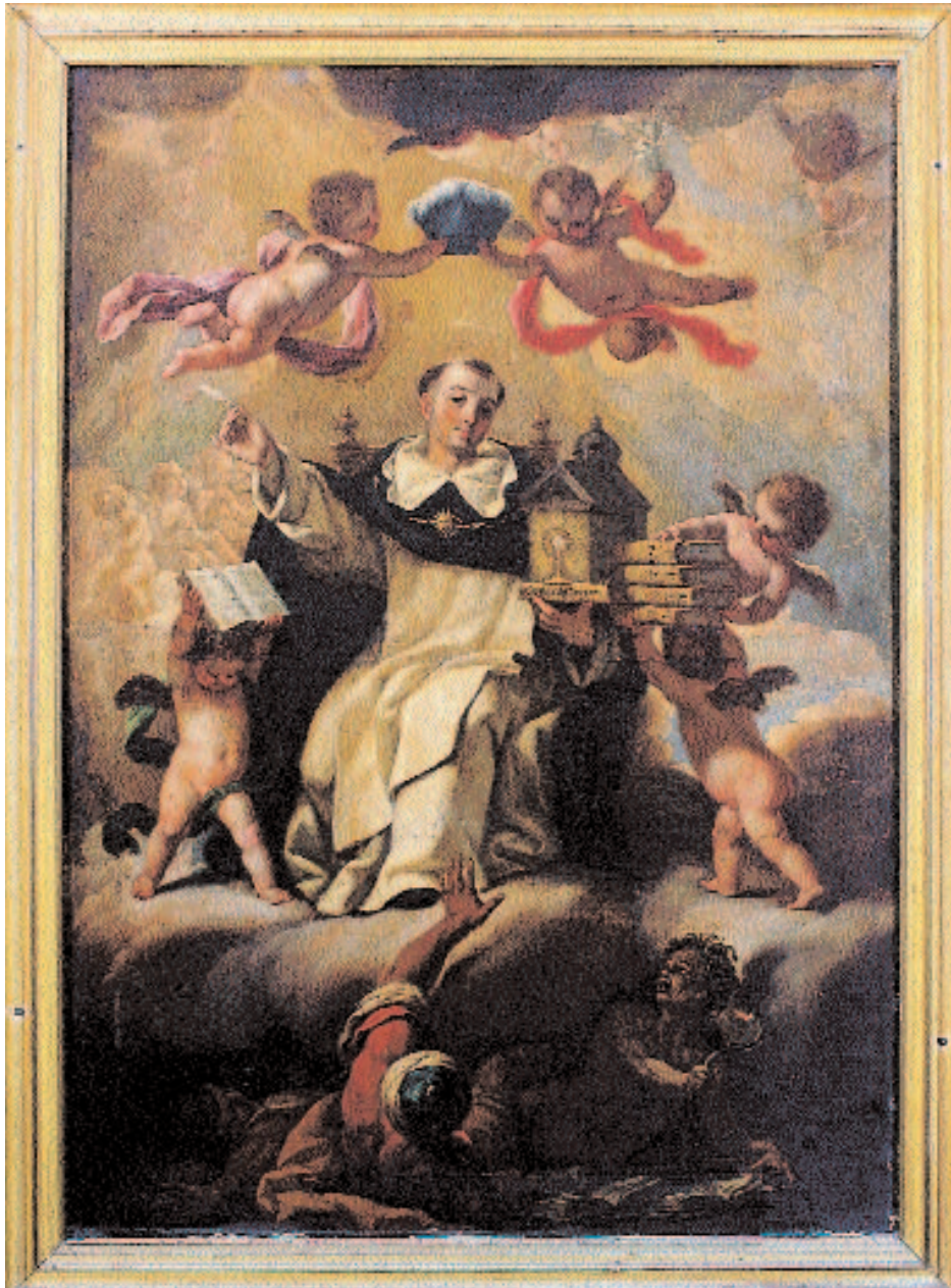
A. Palomino de Castro, Santo Tomás de Aquino (c. 1712-1713)

cual se cumplimentaba la fuerte demanda de una nutrida y exigente clientela repartida por todos los puntos del país.