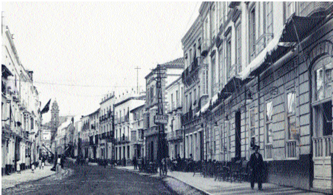
Vista de la Calle Infante Don Fernando o Estepa, también llamada durante la II República Calle Pablo Iglesias (década de los 30)

nuaban siendo los principales objetivos de la izquierda. Es lo que podríamos denominar como el gran «maratón» de mítines izquierdistas, tanto en Antequera como en varios de sus anejos, mítines que tuvieron como elemento vertebrador, el recuerdo a los muertos y presos de Asturias en el 34, el recuerdo también de la pésima gestión desarrollada por la coalición radical-derechista desde 1933 y la necesidad de votar al Frente Popular.