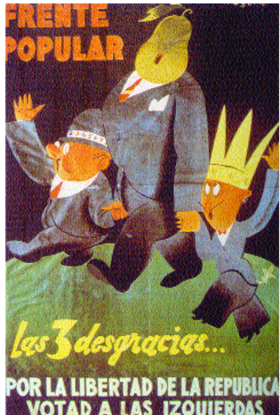
Cartel de propaganda del Frente Popular para las elecciones de 1936.

La repercusión de las coaliciones políticas, tanto de la izquierda como de la derecha, tuvieron su reflejo inmediato en Antequera. En el primer caso, se sucedieron en esos días actos de propaganda izquierdista en varios de los que podríamos denominar como «fortines» de la izquierda local: los anejos y pueblos