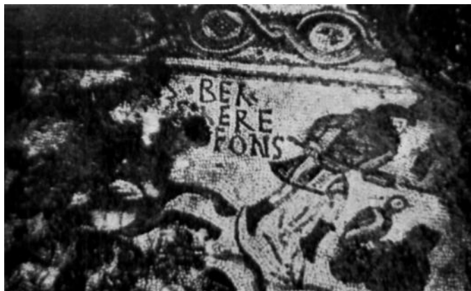
Fig. 2 (según Murillo)

La fábula cuenta como el héroe, huyendo de su patria de Corinto buscó refugio en la corte de Preto, rey de Tirinto, cuya esposa, Estenebea (=Antea), le declara su amor y al no verse correspondida, denuncia a su marido que Bellerofonte ha intentado seducirla. Preto, que no quiso violar, matándole, la costumbre argólide que prohibía quitar la vida a aquél que había sido huésped, le envía a la corte de Yobates, rey de Licia, su suegro, con una carta en la que le pedía que diese muerte al portador. De ahí el nombre que desde la Antigüedad se da, a las cartas con tal contenido, de "cartas de Bellerofonte". Yobates dispuesto a cumplir lo que el marido de su hija le pedía, envía a Bellerofonte a matar a la Quimera, animal monstruoso cuyo cuerpo se formaba con cabeza de león, el protomos de una cabra y una serpiente, que lanzaba llamas y devastaba los rebaños del país. Bellerofonte, con la ayuda del caballo Pegaso, salió victorioso de este primer trabajo, como de los siguientes que le fueron encomendados: la lucha contra los Sólimos, las Amazonas y la emboscada de Licios.